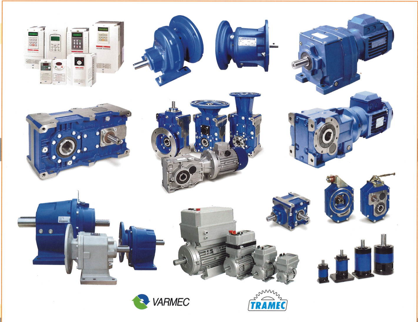
MOTO-REDUTORES, REDUTORES, VARIADORES MECÂNICOS E ELECTRÓNICOS