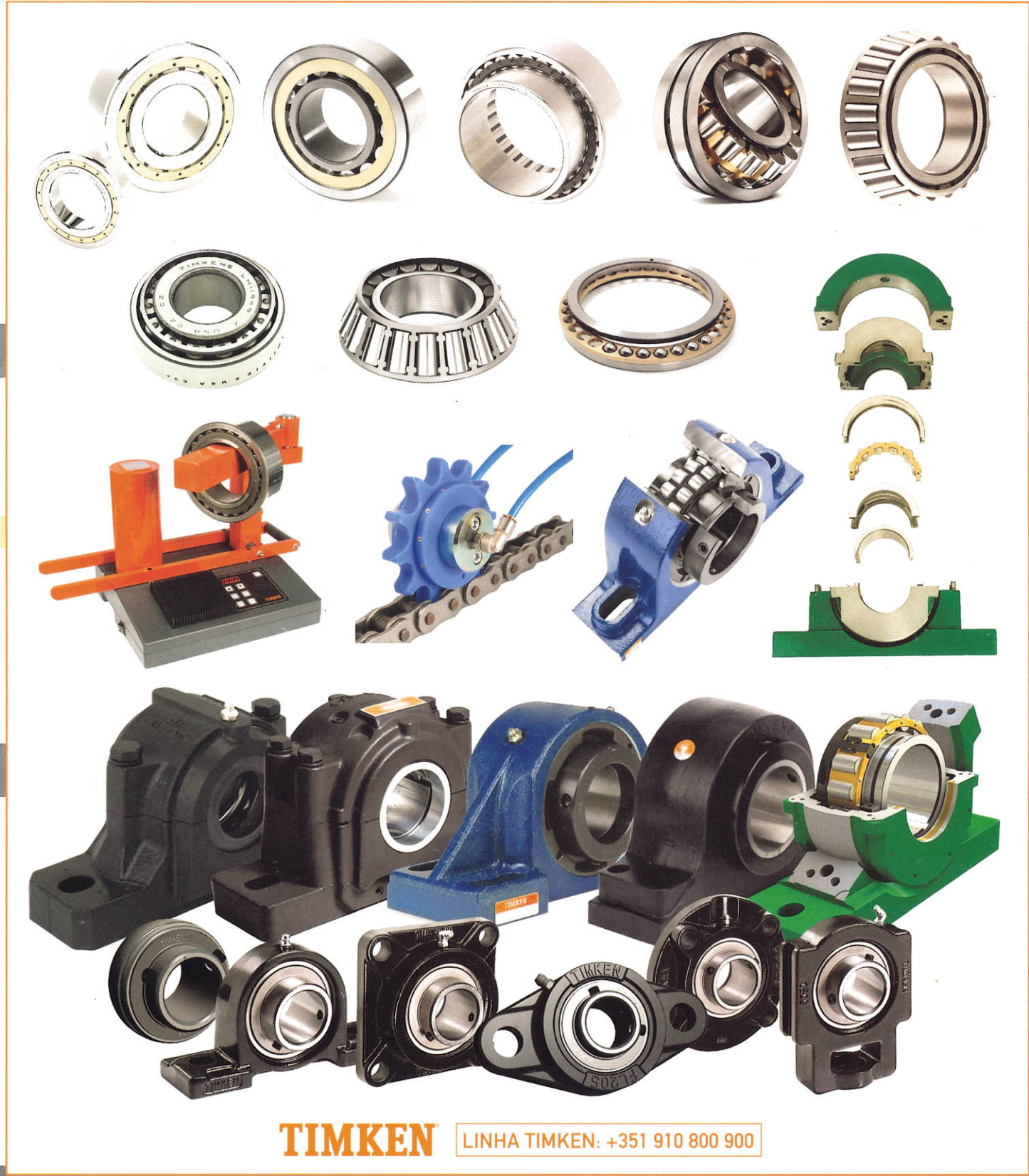
ROLAMENTOS, CHUMACEIRAS E SOLUÇÕES DE LUBRIFICAÇÃO GOTA-A-GOTA