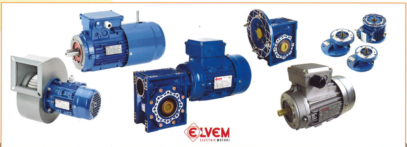
MOTORES ELÉCTRICOS E REDUTORES