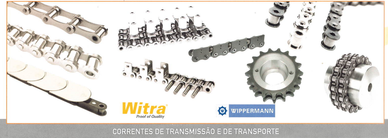
CORRENTES DE TRANSMISSÃO E DE TRANSPORTE