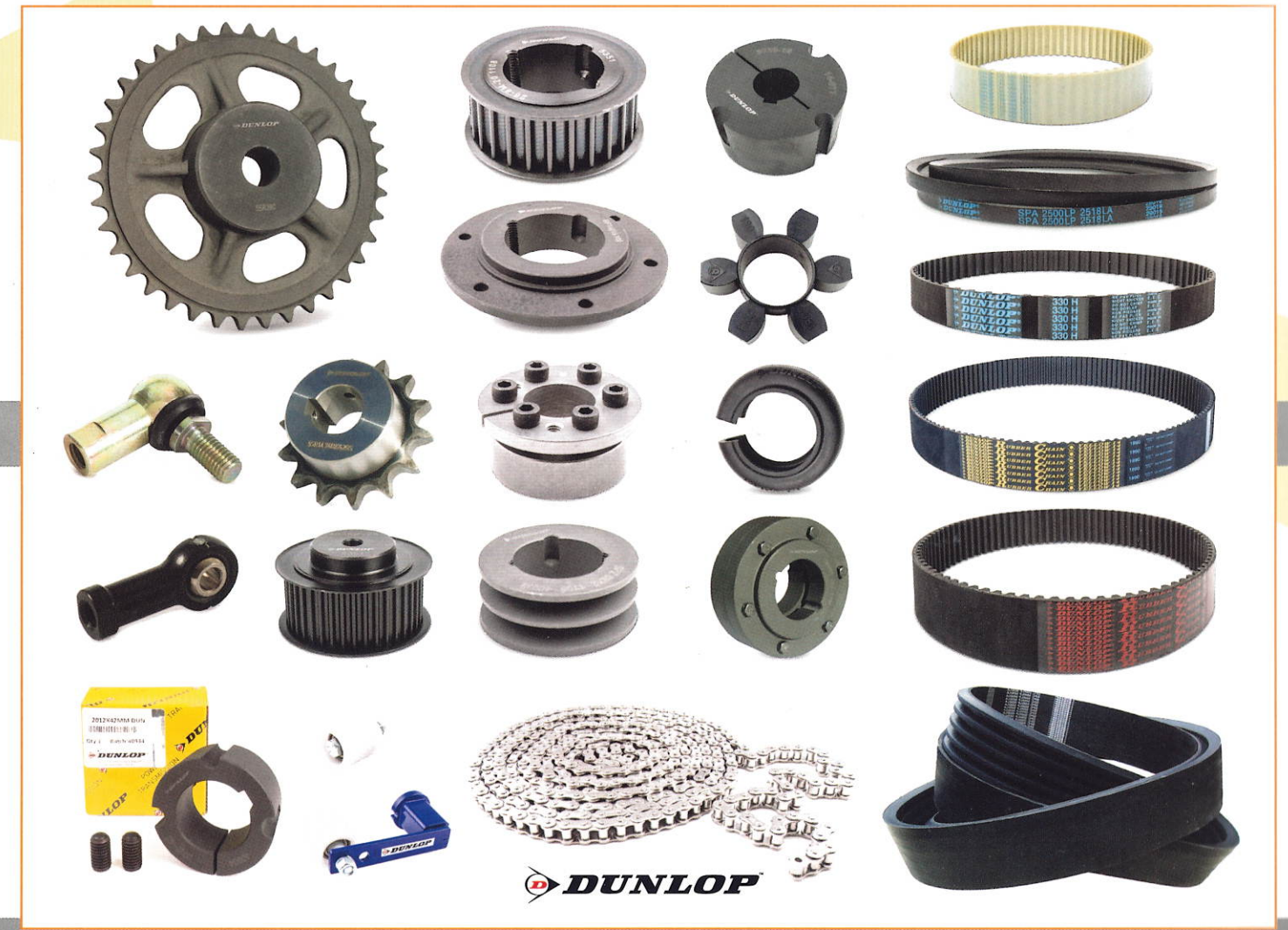
CORREIAS E POLIAS DE TRANSMISSÃO TRAPEZOIDAIS, DENTADAS, POLY-V, CORRENTES E CARRETOS DE TRANSMISSÃO, ACOPLAMENTOS